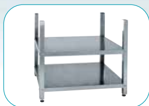
Basamento aperto 43 | 48 | 53 | 60

CE prodotto secondo le normative europee