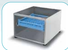
Base chiusa sui tre lati | 60